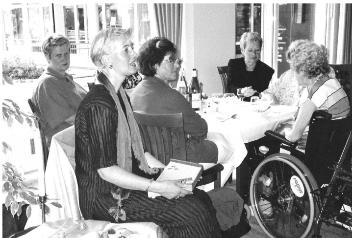
Besuch im Seniorenheim - Sommerfest