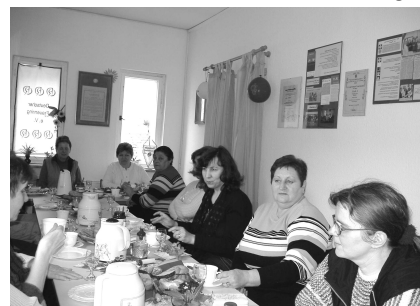
Abschlussfeier vom Projekt VERA