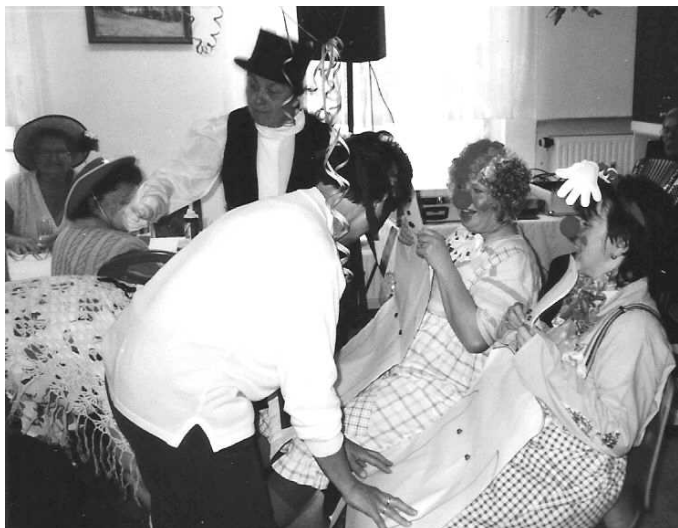
Zirkus im Treffpunkt der Generationen