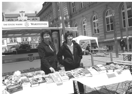
Bücherstand zum Markt der Möglichkeiten