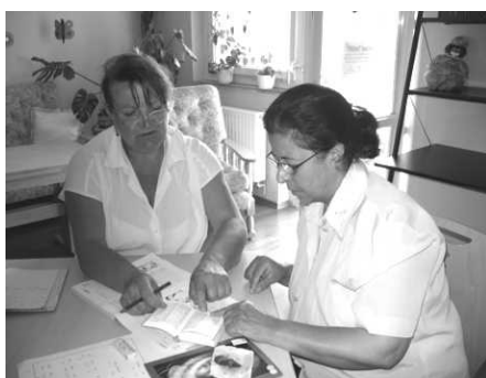
In der Migrationserstberatung

Beschäftigte: 1 Stelle Dipl.-Sozialpädagogin