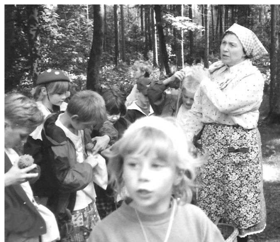
Wanderung mit dem "Kräuterweib"