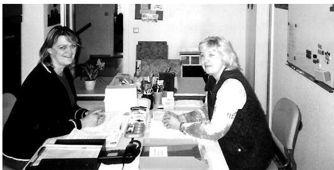
Frauen im Familienzentrum

2 Frauen über AB-Maßnahme und die ehrenamtlichen Frauen des Vereins