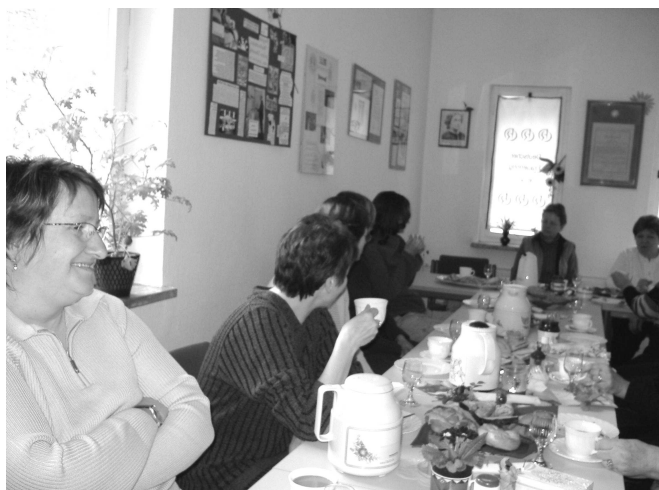
Treffen der Tauschmitglieder zum gemeinsamen Erfahrungsaustausch