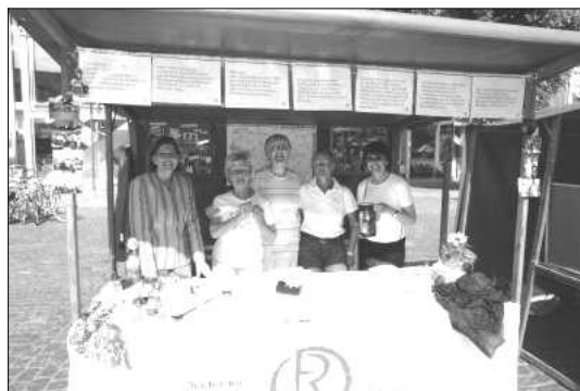
Integrationstag 9. Juni 2006 auf dem Lübecker Rathaus