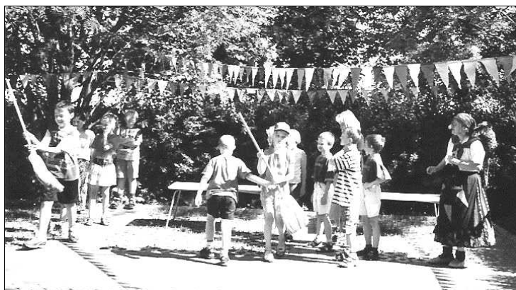
Ein Tag mit der Hexe „Klopsnase“ in der Freizeitkiste Kittlitz