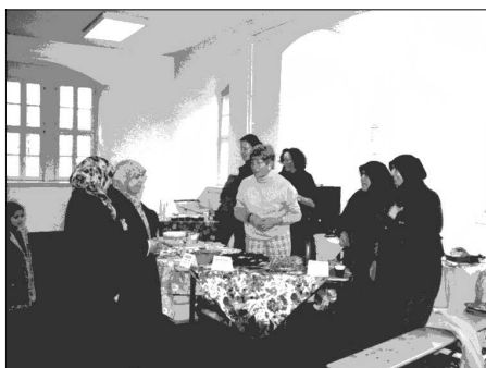
Empfang der Zertifikate häuslicher Krankenpflege