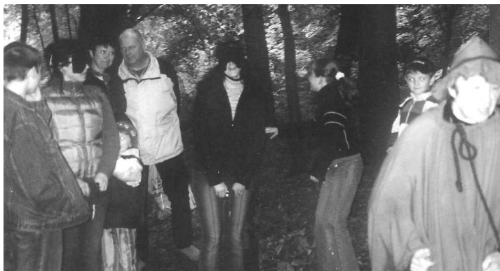
Erlebniswanderung mit dem „Waldgeist“

Beschäftigte: insgesamt 11 Frauen und 2 Männer