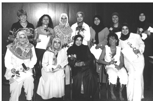
Flohmarkt mit Verkauf von türkischen Spezialitäten