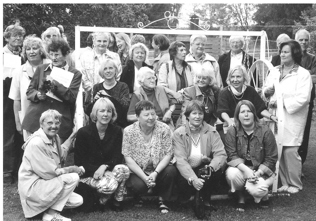
Estland – Exkursion Frauen aus Schleswig-Holstein und Estland