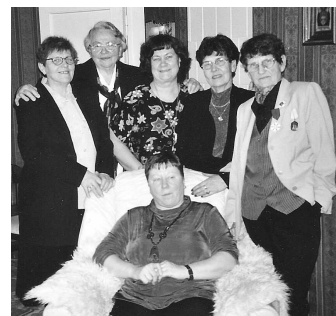
Vorstand – Frauen Union Lääne Virumaa

Partnerschaft und Zusammenarbeit zwischen der Frauen-Union-Lääne-Virumaa (Estnische Republik) und dem Deutschen Frauenring e.V. Schleswig-Holstein. Offizielle Partnerschaftsvereinbarung paraphiert am 19. Juni 1996. Im Rahmen dieser Abmachung streben beide Seiten Austausch und Verbindung in allen Bereichen des gesellschaftlichen Lebens an, vor allem auf dem Gebiet der Stellung der Frau in der Familie und in der Gesellschaft.