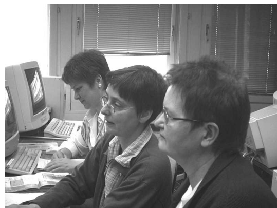
Im Computerraum beim Kurs

Beschäftigte: ehrenamtlich aktive Frauen des Vereins und Honorarkräfte (Fachfrauen für Kurse)